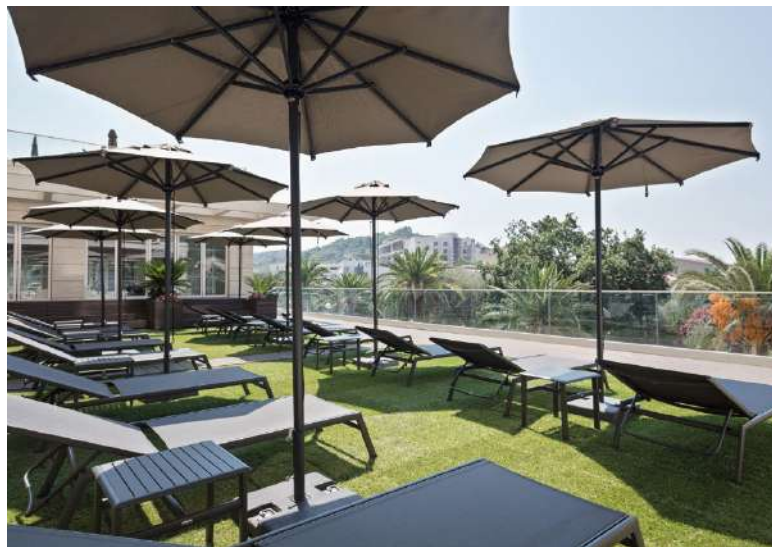
MELIA BUDVA - MONTENEGRO